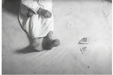
© Gianfranco Mingozzi, film La Taranta, 1962