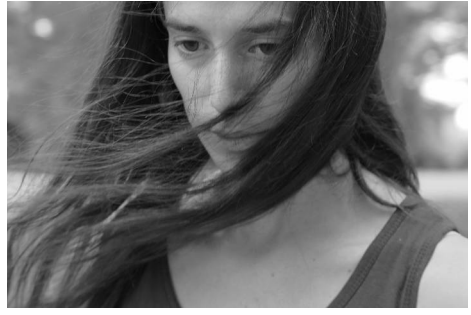
Spectacle "Partir d'une tarentule" de Camilla Cason © photo Elena Uta, Festival Fey'stival, septembre 2022